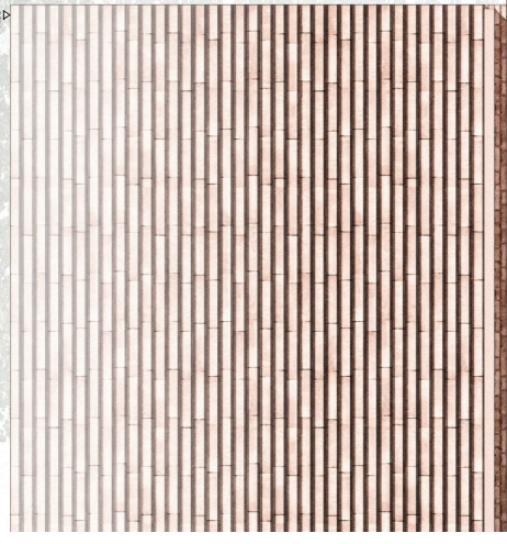
Dachbau - Siedlech Tonziegel (Blick rotbraun) Dach- und Konwierung Uwe spannbolzen Aufsperrdämmung aus Holzfasern WLS 035 Dampfsperre Akustikdache mit Uwekonstruktion Sparren (1x160er) Zuganker aus Stahl (Bridgprofilen)