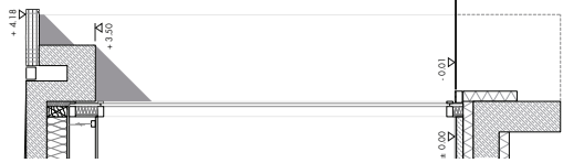
Dachbau - Flachdach Kerndeff: Abdichtung Gießfließschicht 2% Sanierungsdecke Schutzschicht Mineralwolle WLS 032 Abgehängte Akustikdecke